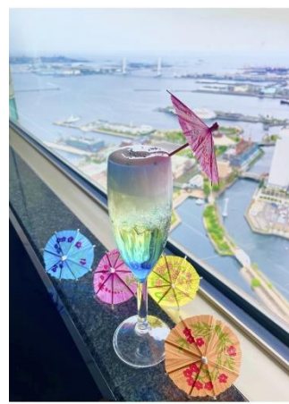
限定ドリンク「空庭慈雨(くうていじう)」